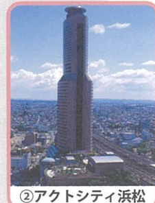
②アクトシティ浜松