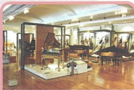
③浜松市楽器博物館