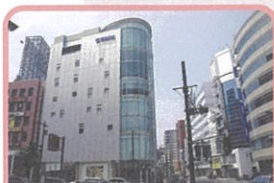
④ヤマハミュージック浜松店