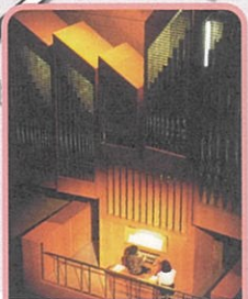
⑧浜松市福祉交流センター