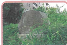
⑥法林寺／野口雨情の歌碑