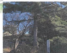
④ 根洗の松石碑 / 信玄本陣