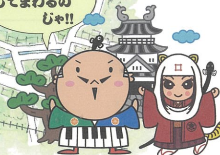
出世大名 家康くん 出世法師 直虎ちゃん