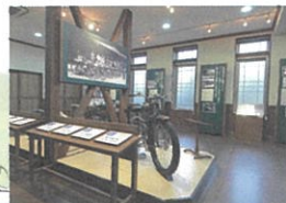
③ 本田宗一郎ものづくり伝承館