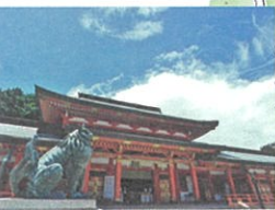
② 五社神社・諏訪神社