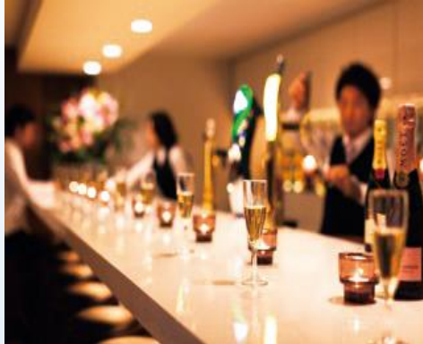
EL The BAR & The LOUNGE