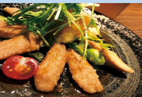
隠れ家Dining Sign 〈サイン〉