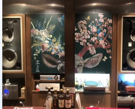
Jazz Bar 不二丘