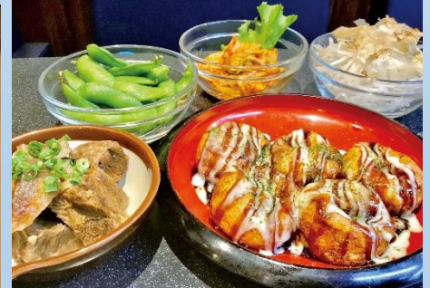
たこりき屋 浜松駅前店