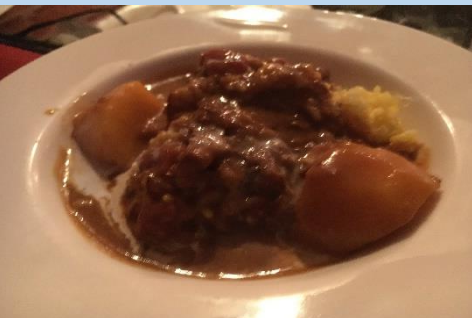
ワインバー みるく