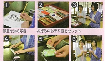
写経紙を折ったため お守り袋に封印 Myお守りの完成