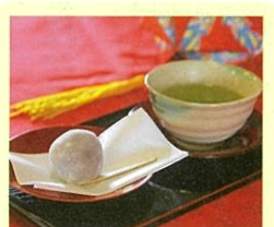
お茶スイーツ ※お菓子等はイメージです。