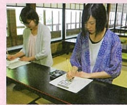
私のお守りづくり