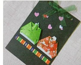
子ども折り紙体験